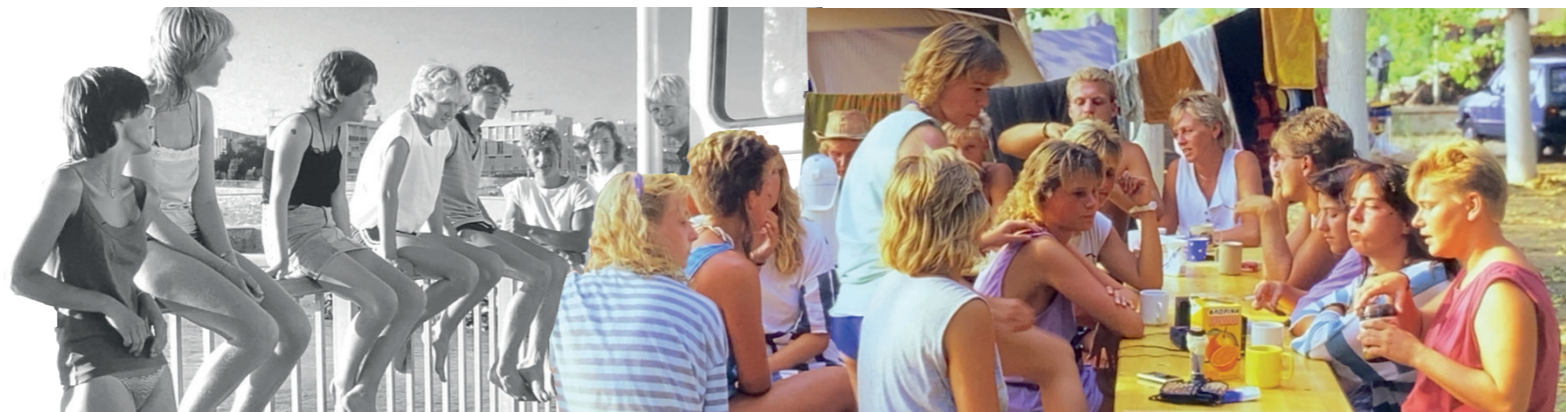
Impressionen unserer Jugendreisen in den 80er-Jahren

Seit Gründung mehr als 100 AUSZUBILDENDE